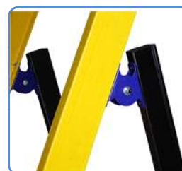
Bisagra de acero