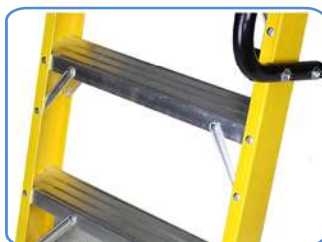
Peldaño de 8 cm antideslizante