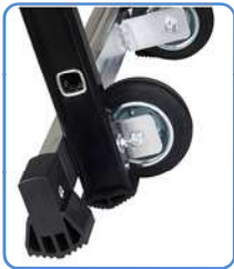
Ruedas Ø125 mm